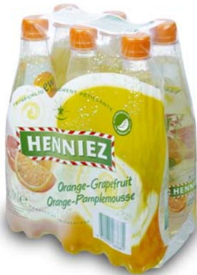
Image 3 Sixpack, bouteilles 50 cl PET