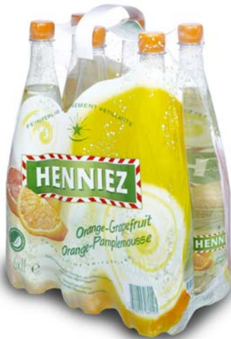
Image 4 Sixpack, bouteilles 100 cl PET